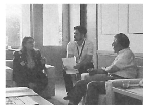
ロータリー交換留学生市長表敬時の通訳