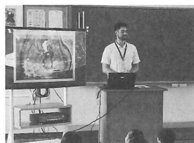
市内小学校で出前授業

11月末には、豊橋というコンフォートゾーンから出ていきます。また不安です。しかし、ここで得た様々な経験のおかげで、前よりは少し自信が付き、また次も頑張れるという根拠にもなりました。そんな豊橋、そしてお世話になった皆様、そして最後まで私の拙い文章に付き合ってくくださった皆様、どうもありがとうございました。