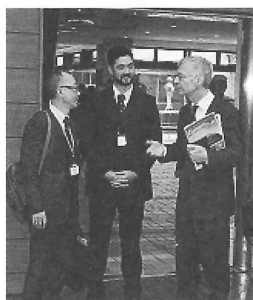
リオアニア訪問団の通訳

てきた人間関係から離れるということ。心地良い環境、すなわち「コンフォートゾーン」から飛び出て、日本という全く異なった未知の環境で生きていく根拠も無かったところ、「これ