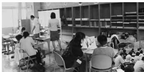
スクールの様子(上)。事前研修会には多くのボランティアが参加(右)

豊橋市内の小中学校には、多くの外国人児童生徒が学んでいます。彼らにとって、日本語能力の向上が日本の学校教育を受ける上で重要なことから、外国人が多く住む豊橋市内の9校区で、今年も夏休み期間中を利用して「外国人児童アフタースクール事業」を実施しました。