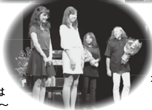
花束贈呈は愛知大学と豊橋技術科学大学(留学生)の皆さん