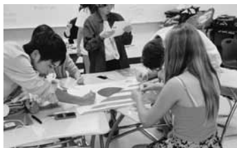
トリード大学生とワークショップ