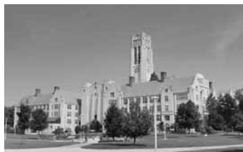
約2週間過ごしたトリード大学

7月19日から8月4日までの17日間、豊橋市の姉妹都市アメリカ合衆国オハイオ州トリード市で開催された「トリード・インターナショナル・ユース・アカデミー 2014」に豊川市国際交流協会と共催で、高校生10名（豊橋市6名、豊川市4名）を派遣しました。彼らは英語による授業や異文化交流を経験し、一回り大きくなって帰国しました。