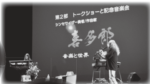
優しさ心地よさにあふれた聴く人を魅了する旋律