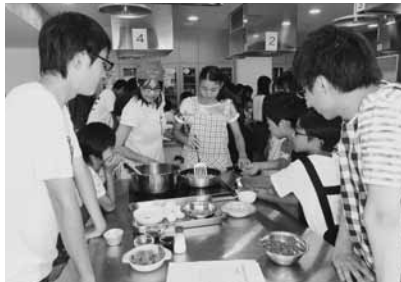
香草をたっぷり使ったタイの定番ごはんをみんなで作りました！