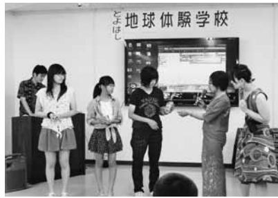
ミャンマー式のじゃんけんも体験! 勝者には幸福を呼ぶフクロウをプレゼント