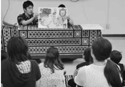
スワヒリ語と日本語で聞く、タンザニアの物語に興味深々!