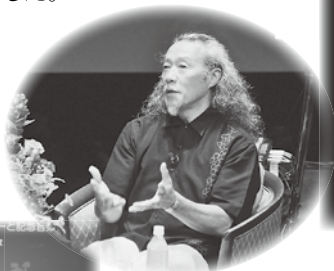
楽しい話題が満載のトークショー