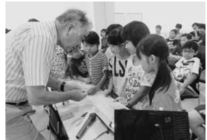
実験を通して、塩分濃度の高い死海の水を体験！