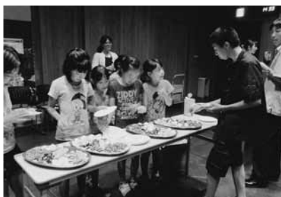
クイズの後は、世界のおやつで一休み