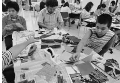
セネガルの布と新聞紙を使って、オリジナルのミニバックを作りました