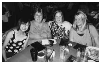
温かく迎えてくれたホストファミリー