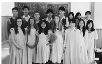
アメリカ文化も学びました