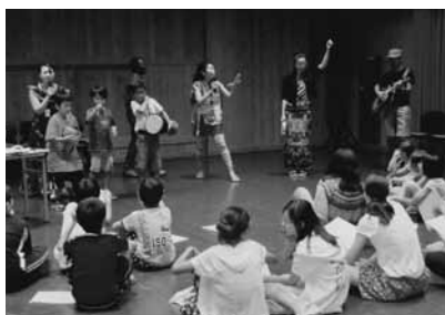
ガーナの歌を歌って踊って！