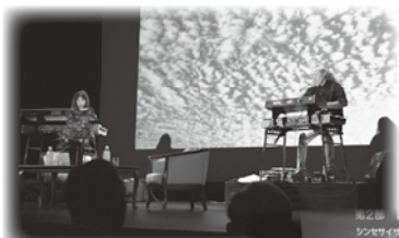
自然と調和しながらもダイナミックな喜多郎さんの演奏

大型スクリーンに映し出された、ご自身が撮った世界各国の自然の風景をバックに演奏される美しいシンセサイザーの音色に、会場は癒しの空間に包み込まれたようでした。