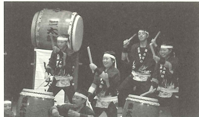
豊丘高校和太鼓部「巴流 豊太鼓」がオープニングに登場します!

※イベントの詳細は、当協会のHP( http://www.toyohashi-tia.or.jp/ )、市内の各施設に設置しているちらしをご覧ください。