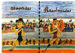
「オリンピック・パラリンピックの 陸上競技」 ラウラ・エリ・キタヤマ・シルバ