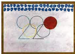
「オリンピックのピクトグラム」 ジオヴァナ・アユミ・ヤマシタ