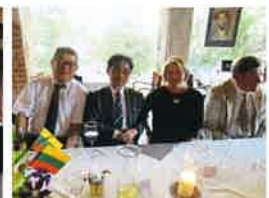
晚餐会前のひととき