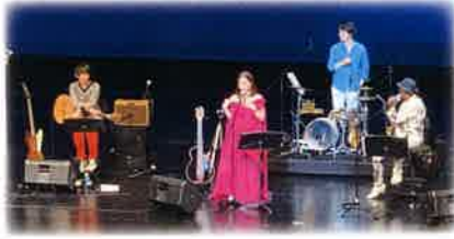
透き通る歌声と軽やかな演奏

式典では、日頃から地域の国際交流、多文化共生に尽力されている個人64名、29団体に感謝状を贈呈、協会で行っている事業を映像で紹介し、同日に