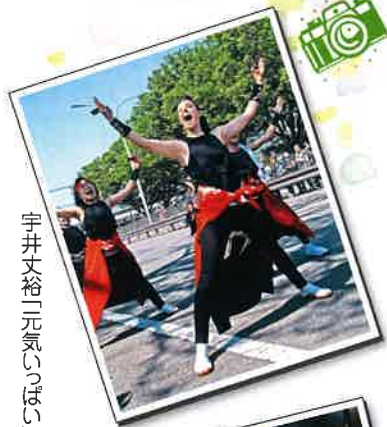
宇井文裕「元氣（げんき）」