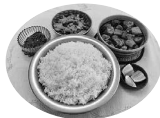
バングラデシュの食事はご飯(白米)が主役(写真は大人2人分)

例えば、日本語でもバングラ語でも、「ご飯」という言葉が炊いたお米と食事の両方を指したり、雨の音を表す擬音語がたくさんあったりするのは、どちらも雨を頼りに稲作をしてきたからだと思えます。ちなみに、バングラデシュは世界で一番多くお米を食べる国だという統計もあるそうです。ピリヤニなどの炊き込みご飯も美味しいのですが、バングラデシュの人が「やっぱり白米が一番」というのを聞くと、日本人と同じようなことを言うなあ、とくすりとしてしまいます。