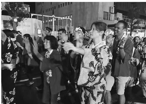
下記写真は昨年度コロナの影響で中止となった事業 [左:豊橋まつり 右:祇園花火鑑賞会]

今年度の在東三河留學生の国籍別の内訳は右記の通りで、アジア圏の學生が大多数を占めています。10年前の傾向と比較してみても、上位国をアジア圏で占める構図は変わりません。国別人数では中国の留學生は半減する一方、マレーシアの留學生がほぼ倍増しています。また、10年前は3位だった韓国が後退しモンゴル、ベトナムが躍進しました。調べによると、2011年当時はK-popの台頭により第二次韓流ブームの最中でした。少なからず留學生の来日が国際情勢の変化等に影響されているように感じます。