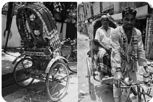
自転車タクシー「リキシャ」は日本語の人力車が語源。背面に「きちんとお祈りをしましょう নামাজ কায়েম করুন」と書かれています。