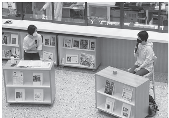
毎月1回開催「館長がいま会いたい人」対談の様子

昨日まで知らなかったことを知る、できなかったことができるようになる、そしてそのことが誰かの役に立つ。シンプルで小さなことの積み重ねが、私たちの日常を豊かにしてくれている気がします。そんな小さな学びの種を散りばめた図書館を目指して、これからも挑戦し続けたいと思います。