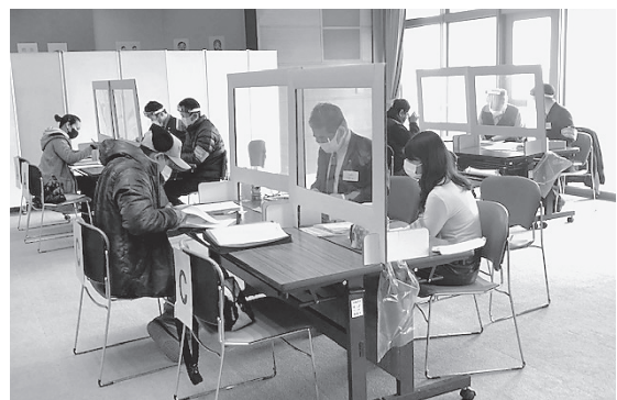
外国人市民で賑わった税務相談会

両日あわせて194人(ブラジル138人、フィリピン48人、ペルー5人、パラグアイ3人)が相談会に参加し、申告書を提出しました。