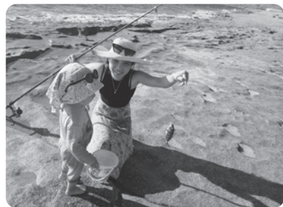
11月でもなんとか泳げます。近所の海岸で娘と孫と一緒に魚釣り

イスラム教国共通の大きなお祭りは、砂糖祭と犠牲祭があります。イスラム暦で行われるので、毎年9日ずつずれていきます。日本の盆、正月みたいに連休になり、里帰りする人が大勢います。砂糖祭は、1か月続いた断食後のお祭りで、どの家でも甘いお菓子を用意し、親戚、友人、知人らを互いに訪問しあいます。子供達は袋を手にあちこちの家を巡りチョコや飴をもらいます。最近では子供達の姿が減ったような気がしますが。