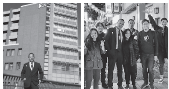
(左)JICAの研修にてJICA横浜の前で (右)横浜中華街で他の研修員らと

高い給料を目当てに日本に来たものの、日本の時間厳守や工場などでの重労働、長時間残業などで外国人は日本文化、共存や共生がどうしてもよくなり、どうせ苦勞するなら最高の時給で稼ぐことができる仕事だけを優先にしてしまう。また、外国人が多い環境に住めば住むほど、日本語や日本文化を学ぶことへの関心をさらに減らしていく。では、その問題を解決するためにどうすればいいでしょうか。ここからは全部私見ですが、日本政府が外国人が密集している地域の近くに無料の日本語スクールを設置すべきだと思います。文化と言葉を勉強するモチベーションをあげるためにしっかり勉強している人にプレゼント、映画のチケット、地元の観光旅行などを提供することもいい提案ではないかと思います。日本が人材を必要としている地域で無料の職業訓練も良いアイデアだと思います。