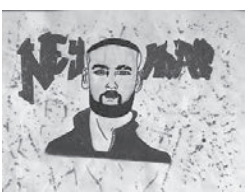
「ネイマール、 世界一のサッカー選手」 ハイワン・ジュニオル・ オカダ・ダ・クニヤ