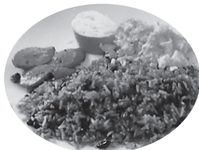
朝ご飯の定番「ガジョピント」

朝ご飯の定番は「ガジョピント(豆ごはん)」という黒インゲン豆を使った料理で、日本の赤飯に見た目は似ています。ただし、お米は日本と違って長粒米でパサパサですが、私は大好きです。