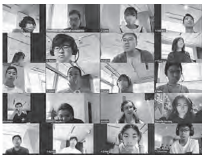
現地トリード大学生とオンラインで交流