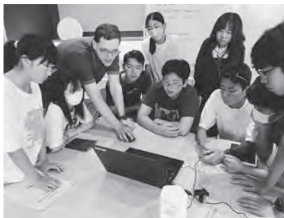
プレゼン制作に取り組む眼差しはどれも真剣