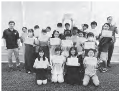
修了証を手に記念撮影