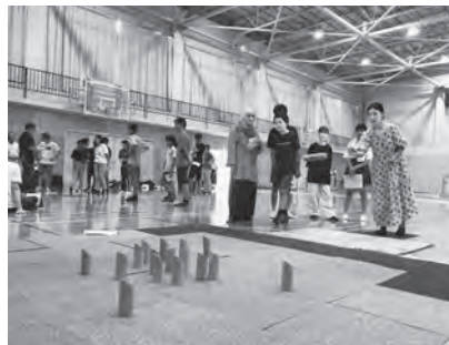
SDGsスポーツ「モルック」