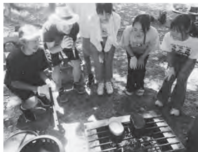
ごはんが美味しく炊けますように