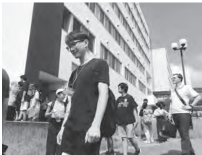
豊橋技科大キャンパスツアー