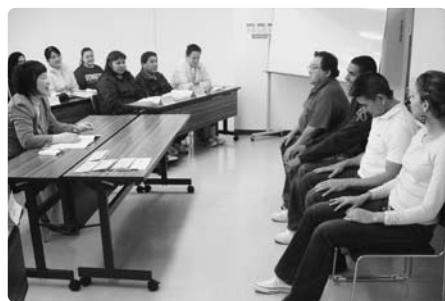
グループ面接ロールプレイング