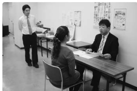
面接の受け答え練習