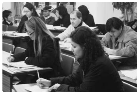
履歴書の書き方練習