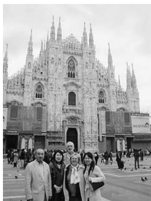
ゴシック様式の傑作ミラノのドゥオーモ(正面)

観光客にとってミラノはミラノコレクションや上品なお店の集まる通りで有名ですし、大変価値の高い芸術作品を所有していることでも有名です。レオナルド・ダ・ヴィンチ作「最後の晚餐」、数多くの5~13世紀に発達したロマネカ(ロマネスク)様式の教会、ゴシック様式のドゥオーモやブレラ地区にあるブレラ絵画美術館など列挙するにはページが足りません。