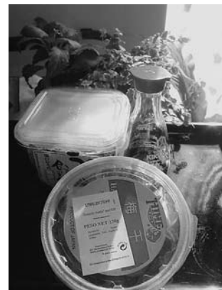
イタリアのしょうゆは懐かしいボトルで健在です

音楽、芸術、モニュメント、劇場、2015年に行われるミラノ博覧会!どれも一見の価値のあるものばかりです。みなさんのお越しをお待ちしています。