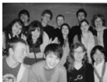
日本語クラスの学生たちと

でいうとその年間の授業料は日本の駅前留学の月謝より安い。しかももし雇用被保険者なら半額を国が負担してくれる。ベルギーの教育システムはほとんどが税金でまかなわれているのだ。道理で給料の半分以上が税金で持たれるわけだ。ま、税金の使い道は教育だけじゃないだろうけど。